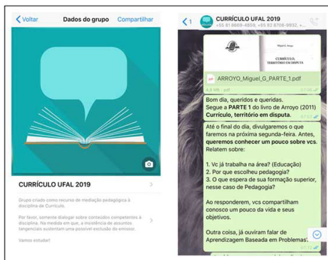
Figura 2. Grupo virtual Currículo UFAL 2019

Segundo Bottentuit Junior e Albuquerque (2016), uma das vantagens na utilização do WhatsApp® é a possibilidade de agregar imagens, áudio, vídeo, materiais digitalizados e ampliação do ambiente de aprendizagem, além de permitir o compartilhamento e aproximar as relações entre os sujeitos.