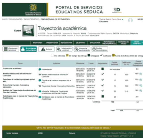
Figura 2. Actividades a cubrir

En esta misma imagen se observan los apartados de bienvenida, presentación, metodología, objetivos de programa, la evaluación, las referencias bibliográficas y el material de apoyo por cada actividad, por lo que desde el inicio el alumno cuenta con la programación del total de las actividades del curso