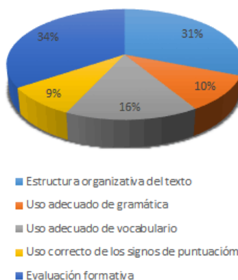
Figura 2. Efectividad del uso de Socrative en la clase invertida

Finalmente, en lo que respecta al grado de motivación de los estudiantes en relación a la metodología de aula invertida y al uso de Padlet y Socrative en el aprendizaje, el 91% de los participantes percibieron que esta metodología es realmente innovadora, pues a más de facilitar el aprendizaje activo y colaborativo dentro y fuera de clases, su uso es relativamente sencillo y no tiene costo alguno para el usuario. Por lo tanto, el nivel de motivación de los estudiantes fue percibido como altamente positivo.